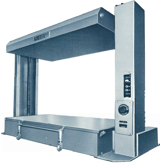
■ KF-P 48型 (引出式)