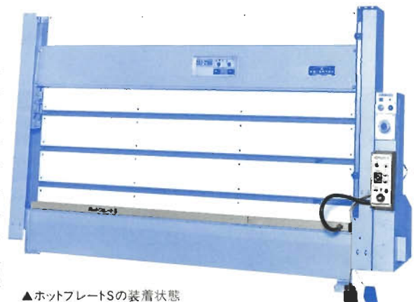
▲ホットプレートSの装着状態