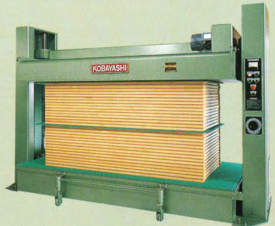
プレスクッション使用例