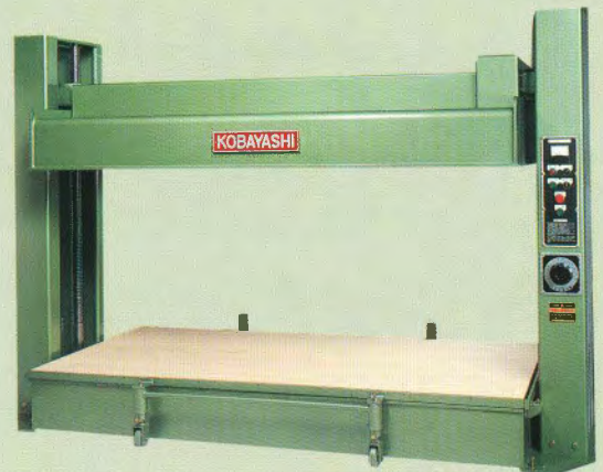
引き出し装置はオプション